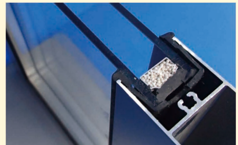
ペアガラスになり近年ますます重くなってきたガラス

住宅の断熱化が進んで、ますます重量化するガラス、サッシ。普段のお手入れをこまめにして頂いて、いつまでも使い続けて頂きたいと思います。