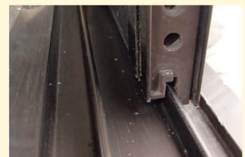
たまにはレールのお掃除も!