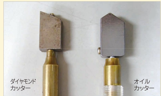
ダイヤモンド カッター

ちなみに、先に埋め込んであるダイヤモンドですが、これはもちろん人工ダイヤです。言うまでもないことですが、宝石的価値はありませんので、あしからず。